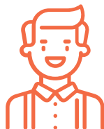
Director / Jefe de gestión institucional