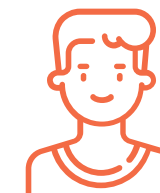
Jefe de personal o quien haga sus veces