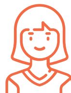
Especialista en racionalización